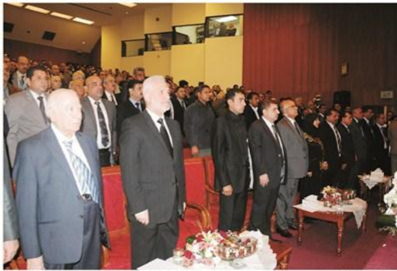
بغداد / التعليم العالي